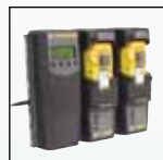
Kompatibel med MicroDock II